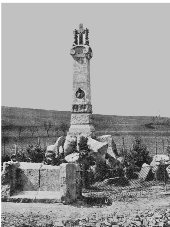
Snímek z let 1911-1914

DOKUD RODIČE ŽIJÍ, CTI JE. ZA MRTVÉ SE MODLI !