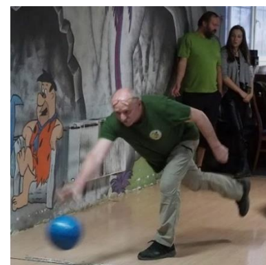
LM / foto LM