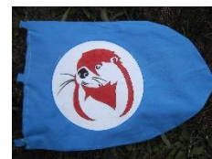
LM / foto LM, Zdeněk Válek