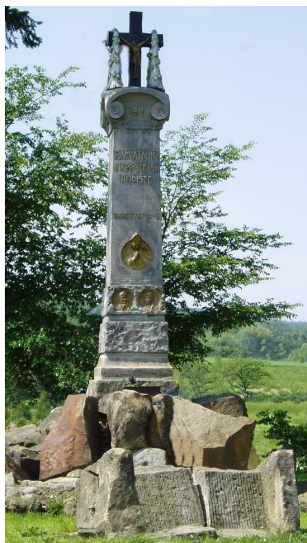
Konec 20. století