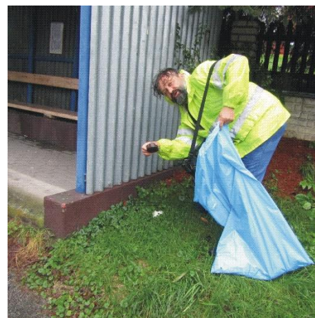
Fotografie z minulých ročníků