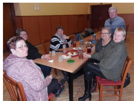
LM / foto LM